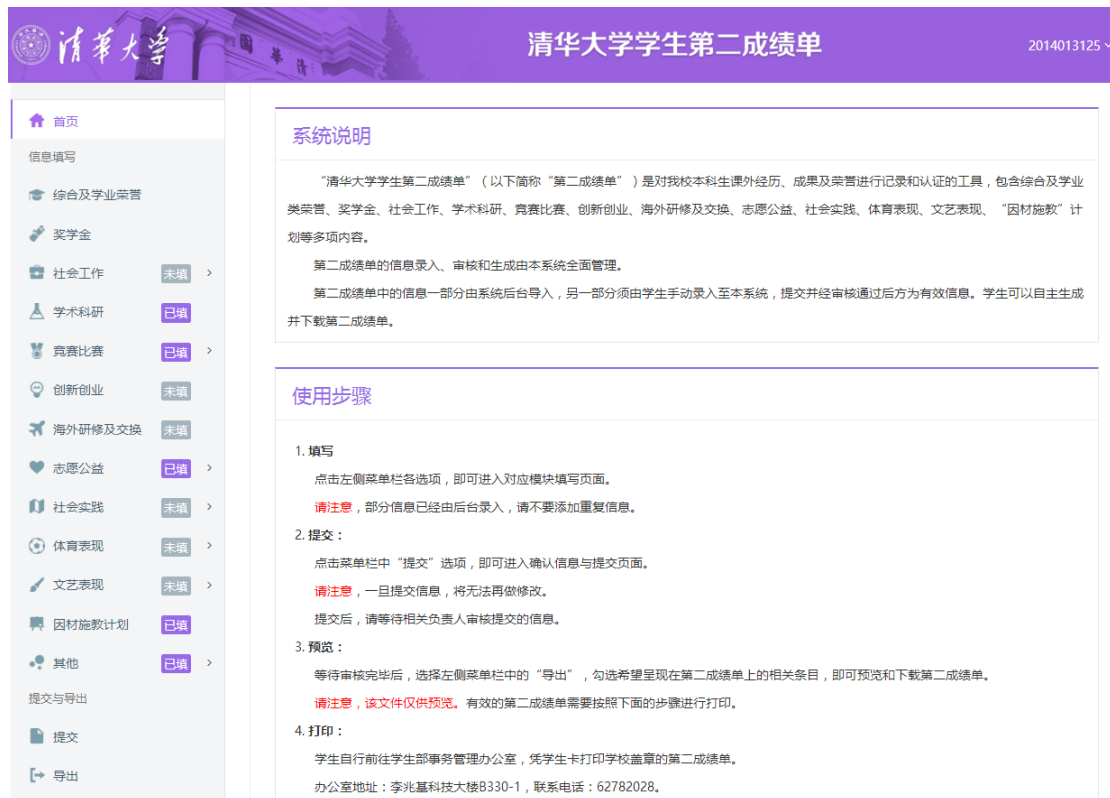
图3 第二成绩单管理系统首页