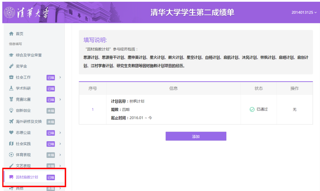
图 4 第二成绩单信息录入 (a)