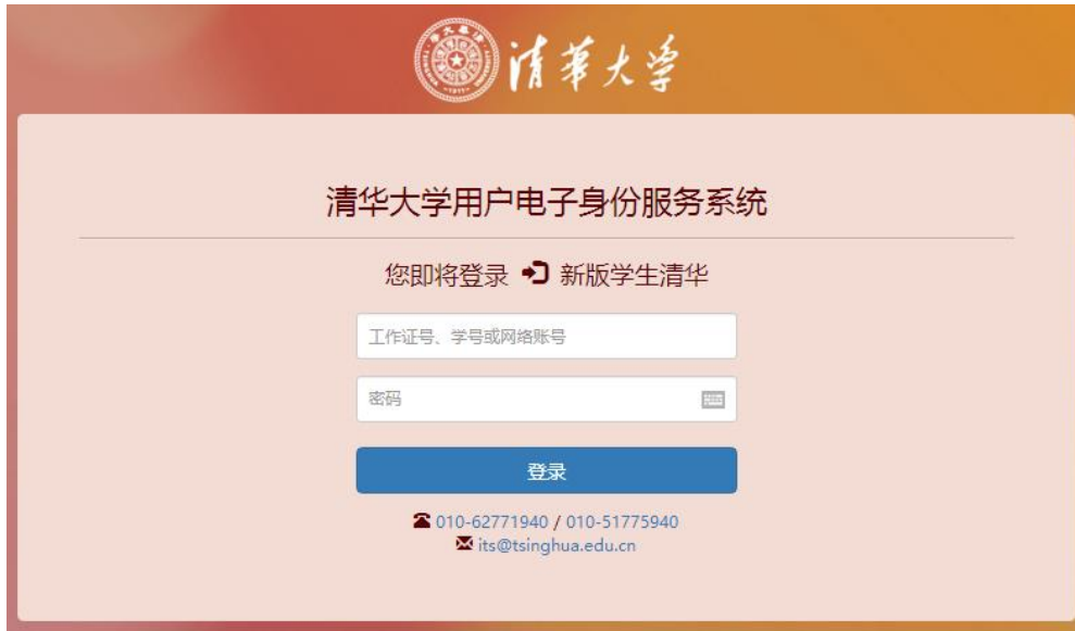
图2 info 账号登录界面