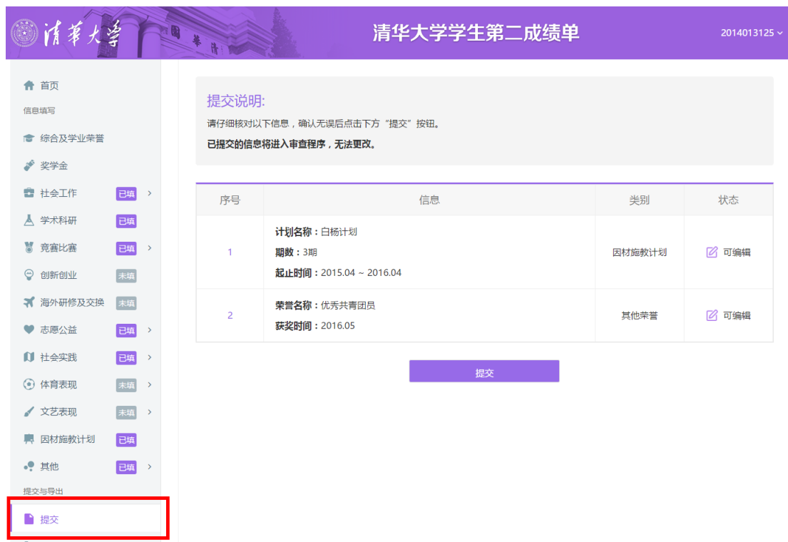
图7 第二成绩单信息提交

进入左侧下方“提交”栏目确认各个栏目的信息正确录入完毕，确认无误后，点击“提交”按钮，等待相关部门对所填数据进行审核，提交后的信息不可以修改；