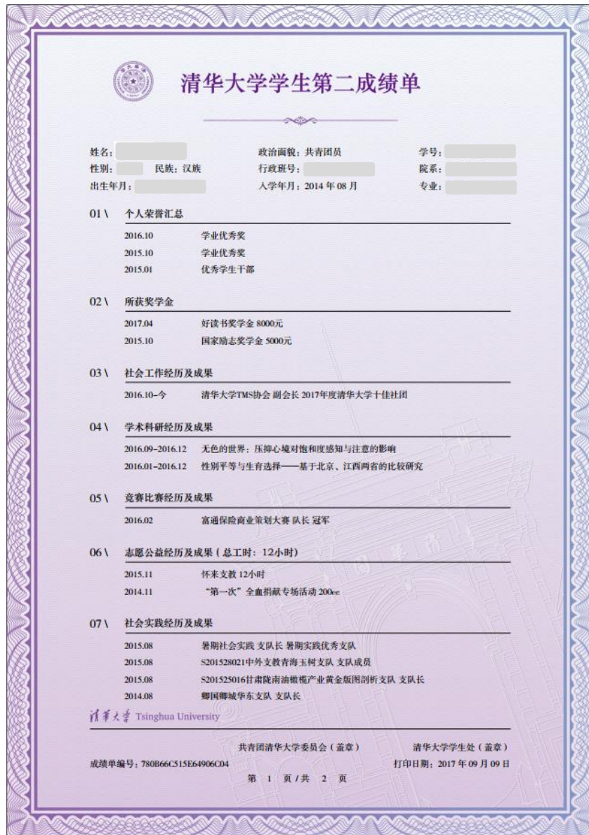
图 9 学生第二成绩单样例