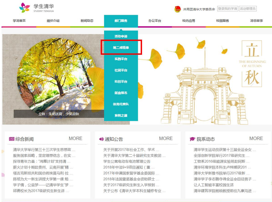
图1 学生清华登录入口

登录学生清华( http://student.tsinghua.edu.cn )，选择首页“部门服务”菜单下的“第二成绩单”；或直接通过域名登录： http://transcript.student.tsinghua.edu.cn 。